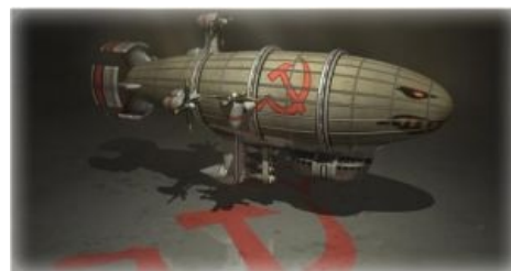
Сферический в ангаре

Экипаж составляют четыре медведя , две комсомолки и политрук .