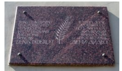
Мемориальная табличка в Санкт-Петербурге