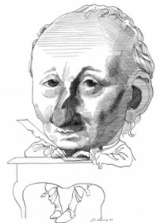
Карикатура на Дидро

«То чтитель промысла, то скептик, то безбожник,