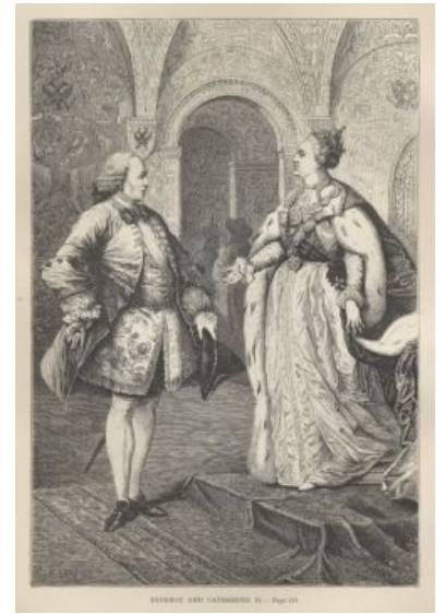
Дидро и Екатерина II