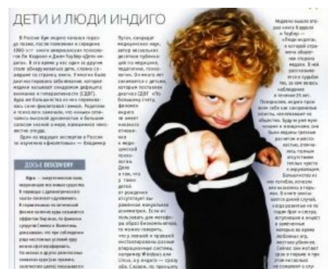
Ребенок индиго смотрит на тебя и какбе говорит...