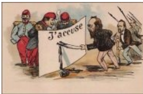
Карикатура на статью Эмиля Золя