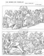
Карикатура Каран д'Аша «Семейный ужин», 14 февраля 1898.

Вверху: «И, главное, давайте не говорить о деле Дрейфуса!»