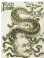
«Предатель гидра-Дрейфус». Антисемитская карикатура, 1894