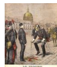
Публичное разжалование Дрейфуса