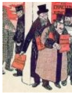
«Богатые евреи готовятся замять дело Дрейфуса». Антисемитская карикатура