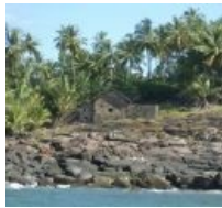
Хижина Дрейфуса на Чёртовом острове в Гвиане