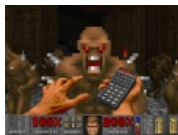
В качестве оружия в Думе