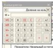
Делим в 1с 8.0