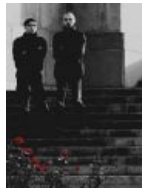
Majdanek Waltz. Ritual Front Презрение

В России «дарк-фолком» часто называют любую мрачную музыку с элементами фолка, хотя это и не совсем верно. Например, русский дарк-фолк «открыл и закрыл» Сергей Калугин аж в 1994 году, на альбоме «Nigredo» (несмотря на тэгосрач, все-таки винрарном). Рада и Терновник и Инна Желанная тоже называли свою музыку дарк-фолком, а группа Мельница — «нео-фолком». Есть и другие. Масла в огонь подливает склонность даже каноничных исполнителей дарк-фолка экспериментировать и отходить от жанра.