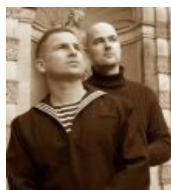
Orplid устремили взоры в глубины космоса