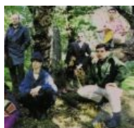
World Serpent Family на обложке « Earth Covers Earth »

Помимо дарк-фолка лейбл выпускал и распространял индастриал (например, Coil или все тот же Nurse With Wound ), а также раритетный замшелый краут-рок вроде Sand .