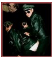
Der Blutharsch пропагандируют крепкую мужскую дружбу