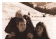
Belborn, порядочная немецкая семья