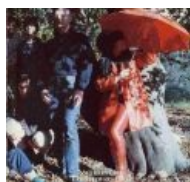
И еще WSF