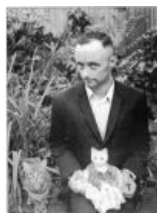
Дэвид Тибет с котиками

Среди некоторых считается самой элитарной дарк-фолк-группой. Единственный ее постоянный участник — Дэвид Тибет, щуплый шизотерик из английской колонии в Малайзии с безумным взглядом и не кислой биографией, эмигрировавший в Англию в детстве с родителями. Позже он вынужден был покинуть семью и шастал по притонам и ночлежкам, пока в итоге не влился в вышеозначенную группу Psychic TV , а затем не создал Current 93 и затем не познакомился с Дагги. Играть ни на одном инструменте никогда не умел, поэтому ради музыки зовет на помощь друзей. История началась с шумового альбома LASH TAL , где слеплены воедино колокольные звоны, какие-то вопли, шумы и прочее — Дэвиду захотелось вызвать сатану , а друзья записали процесс. Ныне он смотрит на это с ладонью на лице и просит не упоминать.