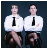
Ordo Rosarius Equilibrio. Суровые, мужественные лица.

Эти два коллектива являются самыми примечательными из всех тех, что воспевают секс в стилистике дарк-фолка.