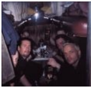
Von Thronstahl заехали на час