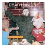
Нет пощады свиньям!