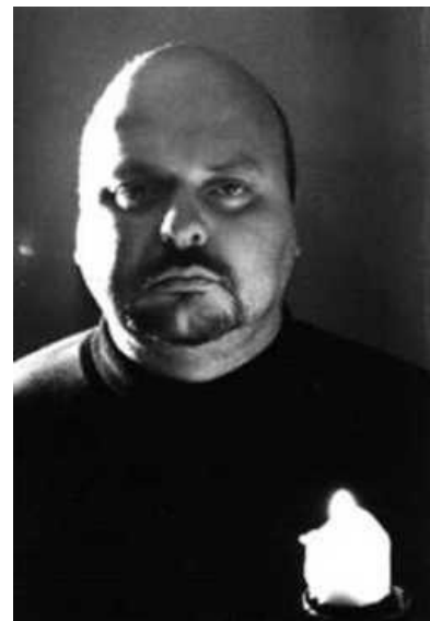
Тони и его усталый взгляд

Несмотря на отсутствие сценического образа, Уэйкфорду надо отдать должное: помимо Sol Invictus, он также играл вместе с вышеупомянутым Стивеном Степлтоном, помогал Тибету с инструментами, да и вообще — основав в 1990 году свой инди-лейбл, он печатал на нем разнообразную макулатуру на тему неофолка, чтобы народ узнал о жанре. Кроме того, он и придумал называть свой жанр «folk noir».