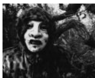
Та самая маска

— Дагги поясняет свое отношение к нацизму