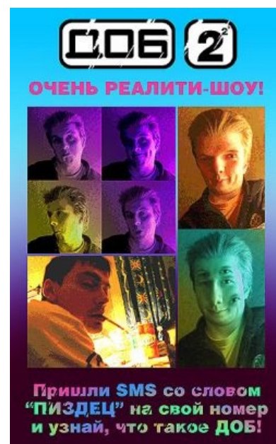
ДОБ 2. Очень реалити шоу

ДОБ сужает сосуды на теле, а это в течение долгого времени может привести к возникновению гангрены.