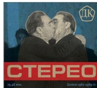
Обложка альбома «СТЕРЕО» как пример хорошего троллинга