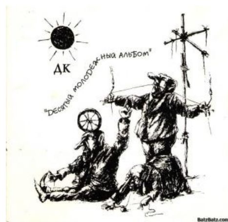
Десятый молодежный альбом