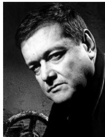
Батя смотрит на тебя, как на Андропова