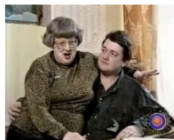
Батя смотрит на Новодворскую , как на Новодворскую