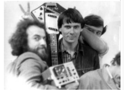
Вглядитесь в их одухотворённые лица