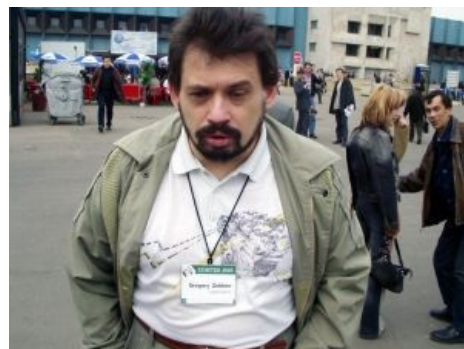
фото с Комтек-2003 23.04.03