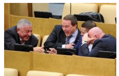
При ближайшем рассмотрении