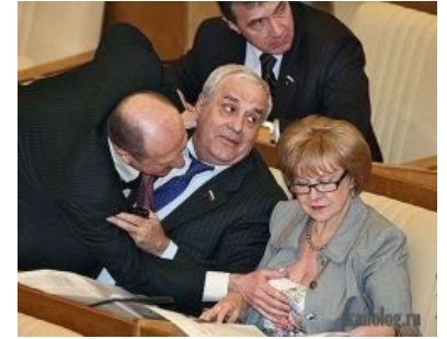
Заседать в думе, это вам не сиськи мять

Примерный сценарий работы думы выглядит так: