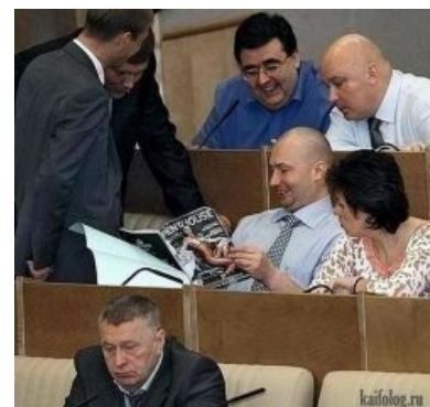
Основной вид деятельности