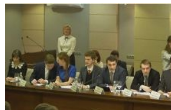
На самом деле вот. А то гости из Думы