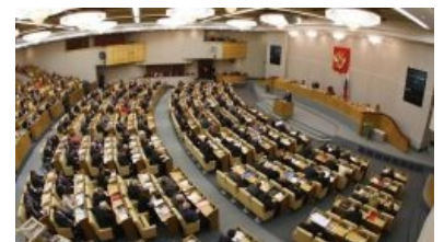
Управляем государством , каноничный вариант

В то время было отчетливое понимание всеобщего пиздеца. Буржуи захапали себе все добро, рабочие недоедали, крестьяне как бы свободны, но как бы нет, Европа активно прибирает к своим рукам природные богатства , а всех неугодных стреляют аки бешеных собак. Ежу понятно,