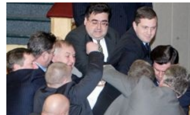
Суть дум того периода

Во-первых — законопродумыванием (ибо распил денег может проводиться только при помощи и прикрытии сим действием). Однако, проблем в первые годы было много, если не сказать больше. Всё, что России досталось от совка в плане норм, законов, ГОСТов было красиво, но к сожалению, для неплановой экономики не подходило, а потому приходилось многое переписывать почти с нуля. Благо, что продвинутый Запад и спонсорские США уже имели неплохую законодательную базу, которую после правильного перевода можно было выдать за тяжкие мозговые потуги депутатов.