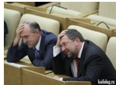
Действия оппозиции вызывают лишь двойной фейспалм

14 октября все 3 «оппозиционные» фракции покинули зал заседаний Государственной Думы в знак протеста против фальсификации итогов выборов и потребовали пересчета голосов. В ответ единоросы устами Грызлова обвинили оппозицию в саботаже, а также не преминули напомнить, что «отсутствие представителей КПРФ, ЛДПР и „Справедливой России“ не приведет к срыву заседания...», указав последним на их истинное место