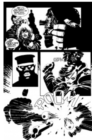
Суть™ одной картинкой