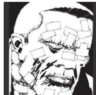
Марв смотрит на тебя, как на убийцу своей богини