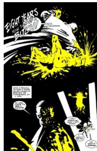
Хартиган в один из