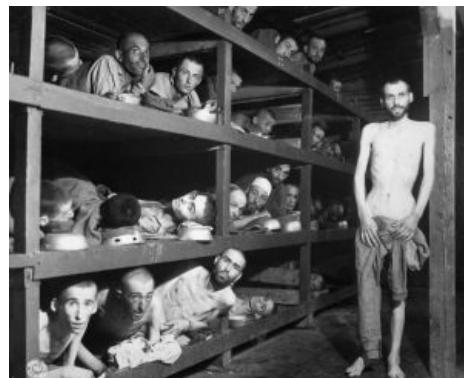
Узники Бухенвальда выражают своё мнение по поводу содержания этой статьи?

Головной моск, даже минуты зело глубокого измышления использует лишь 10-15% своего объёма, а, значит, в нём заложены архимощные способности, которые пока ещё не раскрыты. IRL самый мегасовременный зомбящик со спутниковым телевидением, тоже, за раз показывает не больше одного канала, что почему-то никаких заумных вопросов не вызывает. Факт, что мозг, утруждающий за раз несколько процентов объёма, при измышлении на разные темы, использует разные области, в сумме дающие единицу, известен уже давно. Что не мешает фантастам иметь profit с очередного высера на данную тему. На самом деле в этом вашем моске все функции многократно дублируются. Именно поэтому человек не превращается моментально в слюнявого идиота от сильного удара по голове или от пьянки, наутро после которой в унитаз уходит over 9000 нейронов . Их функции просто переходят к другим таким же. Правда, если бухать или получать по голове слишком часто, этих запасов начинает не хватать, и вот тогда начинаешь ощущимо тупеть.