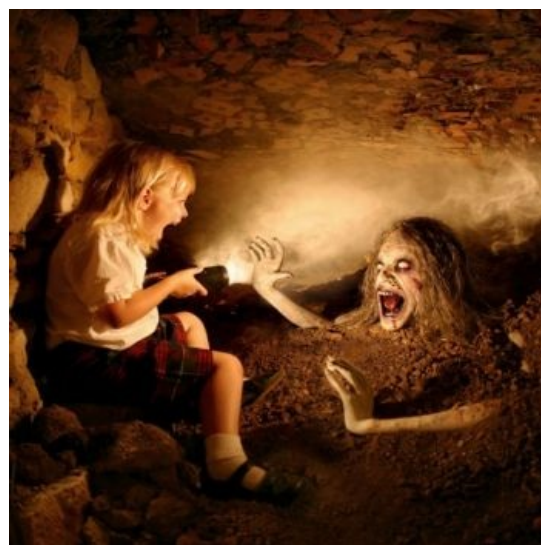
Городские легенды — это просто выдумки

Университете штата Юта (США) работал преподаватель английского языка профессор Ян Гарольд Брюнванд . Брюнванд до студенчества занимался изучением современного фольклора, и в какой-то момент своей карьеры он внезапно осознал, что США просто должны дать ему денег для проведения особо нужных для страны исследований. Для получения соответствующего гранта он решил более глубоко исследовать современный американский фольклор. На основании своих изысканий в 1981 году он