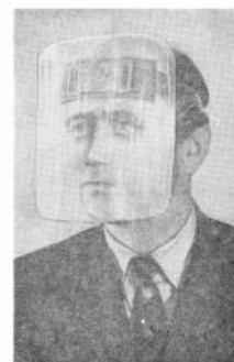
Рис. 3. Защитная маска

В комнате, где стоит телевизор без футляра с цельностеклянным кинескопом, нельзя находиться людям без защитных масок. В эту комнату нельзя впускать детей. Проводить проверку ламп и деталей постукиванием на включённом телевизоре следует только с помощью специальной изолированной палочки.