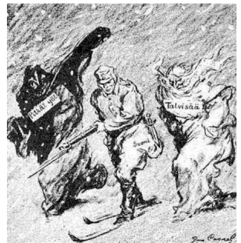
«Финские союзники: длинные ночи и зимняя погода». Плакат тех времён

Первая попытка прорвать «Линию Маннергейма» была предпринята при слабом морозце и небольшом снежке, но закончилась грандиознейшим провалом из-за хреновой работы разведки, которая не смогла узнать расположение многих ДОТов и снайперских точек. Это был действительно грамотный