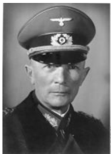
Фон Бок удивлён

В 1941 году, изголодавшись от недостатка жизненного пространства, Гитлер вторгся в СССР. Уже в июле вермахт повстречался с передовыми частями метящего в генералы полковника Распутицы (см. дневник фон Бока), а начиная с сентября, прославленный полководец всеми силами обрушился на растянутые до предела коммуникации вермахта, превращая тыловое обеспечение в адЪ. В результате контрударов Жукова под Ельней, отвлечения Будённым и Кирпоносом Гудериана и Клейста под Киевом и успешных действий Распутицы в тылу вермахта наступление на Москву удалось немцам начать только 30 сентября.