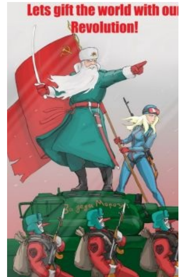
Генерал Мороз на учениях