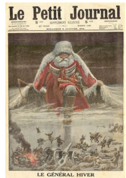
Генерал Фейлор: генерал Мороз носит шубу не того цвета