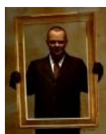
Что-то в нем от Хитмана...