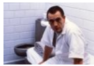
В исполнении Брайана Кокса