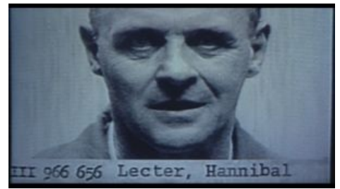
Нотариально заверенный скриншот

— Ты кто такой? - поинтересовался смуглый парнишка с первого ряда. — Лектер — улыбнулся я. — Лектор! — восторженно завопила аудитория — У нас новый лектор! Значит, старая сучка всё-таки сбежала! Хааа! Да вы только посмотрите на этого белого индюка! — А почему месье пришел именно к нам? — вкрадчиво спросили откуда-то сбоку. — Месье хочет учить бедных мальчиков? — Месье попросили старые друзья. — Гыгы! У месье есть друзья! У свиней бывают друзья! — ученики веселились во всю. — Наверное у месье есть какое-то имя? Мы же не хотим называть нашего нового друга просто лектором? Давай, не бойся, скажи нам, как тебя зовут! — Я уже говорил вам, как меня зовут. Вы просто неправильно меня поняли, дети — ответил я, аккуратно закрывая на ключ дверь аудитории. — Лектер — это не должность. Это моя фамилия. А зовут меня Ганнибал.