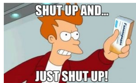
Фрай предлагает успокоиться