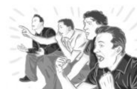
Зарисовка от художник-куна