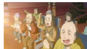
Онемэ «Miss Kobayashi's Dragon Maid»