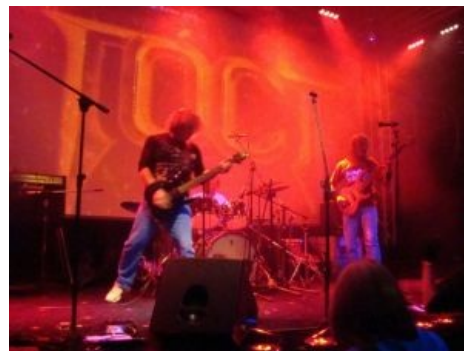
Есть такая группа