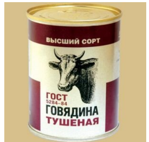
Тушёнка по ГОСТу. Год 84 и отсутствие буквы Р кагбе намекают, что есть безопасно.

«Жесть, как она есть! Вообще, же-е-е-есть! Всем смотреть обязательно! ГОСТ 13345-85 »