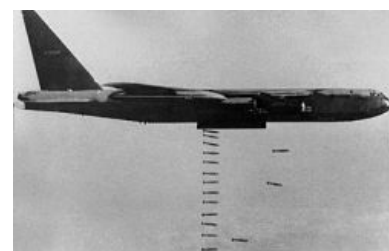
Активная агитация. Б-52 разбрасывает кассетные пропагандистские листовки

Как и большинство вундервафель того сурового времени, он разрабатывался вовсе не для того, чтоб желтокожих по лесу гонять, а для ядерного экстерминатуса СССР путем неприцельного (!) ядерного бомбометания. Точнее, визуально неприцельного — радиолокационный прицел-то там был, но различал цели размером минимум с военную базу. Однако с экстерминатусом не сложилось, а без эпичных ковровых бомбардировок янки не воюют. Вот и понес оснащенный простейшим оптическим визиром «Стратофортресс» тонны гуманитарной помощи под крыльями демократии в партизанские джунгли, превращая отдельно взятый участок леса (2,5 км в длину, до 0,8 в ширину) в филиал Луны на Земле. Поговаривают, что даже далекий разрыв бомбы, сброшенной с Б-52, мог привести к разрыву легких. Из-за более далеких кровоточили глаза и уши. У амеров самолет получил неофициальное название BUFF, что в переводе означает вовсе не обкаст полезными заклинаниями, как могут предположить некоторые недалёкие любители MMORPG, а аббревиатуру, расшифровывающуюся как Big Ugly Fat Fucker . К слову, позывной "BUFF" (плюс две цифры) в настоящее время активно юзают отлично сохранившиеся в ВВС США экземпляры Б-52.