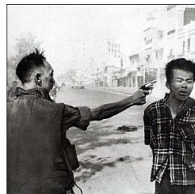
Собсно, общение с пленными [3] .

— Пытался сбежать, — сказал кто-то сбоку от меня. — Как он сбежит, он же связан. — Он пошевелился. Значит, пытался сбежать. Следующий пленный, увидев над собой сержанта, торопливо проговорил несколько слов по-вьетнамски. Когда сержант пнул его, он закрыл глаза. Голова дернулась от удара пули. — Это убийство! — прошипел я. — Они сержанту Роччи хуй отрезали. И вставили в рот.