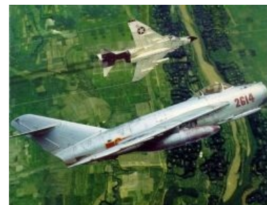
МиГ-17 против McDonnell Douglas F-4 Phantom II

«Фантому» достался первый вин в воздушном бою. Утром 9 апреля 1965 года «Фантом» сбил ракетой «Спарроу» китайский МиГ-17, после чего сам был подбит из пушки другого МиГа, хотя есть также мнение, что был сбит другим «Фантомом». Экипаж не катапультировался и утонул в море вместе с самолетом. For the Great Justice , на лавры первого МиГ-киллера претендуют F-100 и F-105, 4 апреля 1965 после махача с ними чарли не досчитались трех МиГов. Всего в ходе войны было потеряно почти 900 Фантомов, столько реактивных истребителей не теряла ни одна страна ни в одном конфликте. Причем своим войскам Фантомы причинили ничуть не меньший ущерб, чем вьетнамцам. Самыми эпичными был пожар на авианосце «Форрестол», тогда из-за последовавшего в результате замыкания цепей управления случайного пуска ракеты с одного из плотно стоящих на палубе Фантомов было уничтожено 29 самолетов и 42 повреждено, погибло 134 американца (Маккейн, к сожалению, выжил, показав класс в применении съебатора). В другом случае Фантом протаранил заправщик C-130, заправляющий в это время два других