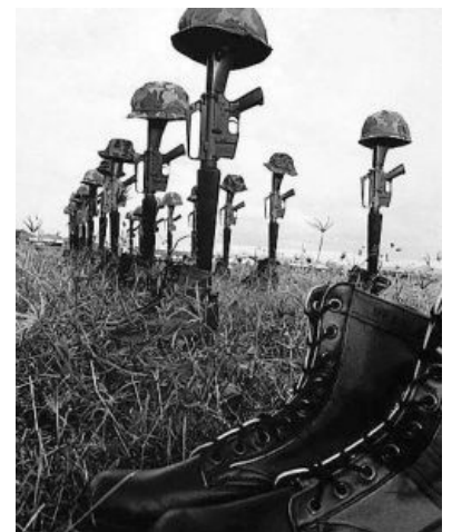
Конец немного предсказуем

К разгару боевых действий у Южного Вьетнама была собственная немаленькая армия, вооруженная американским оружием времен второй мировой и первых послевоенных лет (современные винтовки М-16 начали приходить на смену древним «гарандам» в середине войны). Удивительно, но будучи одним народом с северными, они не умели и не любили воевать. А, скорее всего, воевать за белого господина со своим же народом не очень-то и хотелось: половина боялась северных, а половина им симпатизировала, ибо проамериканские власти достали даже буддистов — ведь с ростом американского вмешательства усугублялся и пиздец в экономике. Нередки были случаи отказа идти в бой, даже танками против пехоты. Вдобавок в частях царили казнокрадство и поборы за всё — от еды и формы до повышений по службе — а также вытекающий из этого грабёж своего же населения. Неудивительно, что боеспособность такого войска, даже несмотря на хорошую вооружённость во второй половине войны, оставалась весьма низкой — как бы американские пропагандисты не превозносили отдельные успехи.