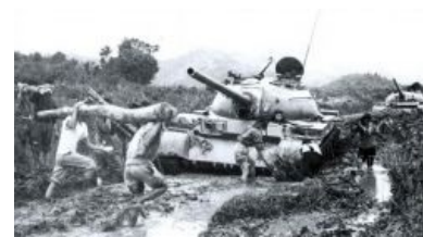
Военные будни. Т-54 в сезон дождей

«Когда отгремел последний выстрел, под пологом лиан воцарилась тишина. Голос с сильным акцентом возник в штабной рации командира роты: «Присылайте еще солдат. Эти уже кончились». »