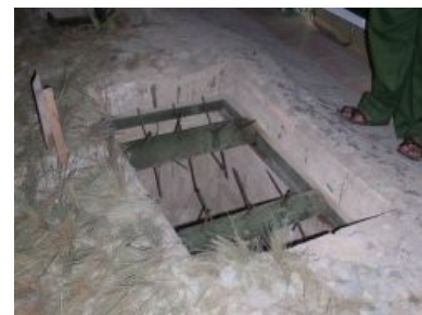
Демократию встретили с распростертыми руками

Для изготовления мин и фугасов взрывчатое вещество часто добывалось из неразорвавшихся американских снарядов и бомб . Помимо этого древневьетнамская охотничья смекалка порождала самые изощренные ловушки. Тут вам и замаскированная яма с бамбуковыми кольями (которые вьетнамцы, к слову говоря, не гнушались мазать собственным говном, так как при ранении солдат мог выжить, а тут заражение крови вдобавок (кто знает, что за звери живут у вьетнамцев в кишечнике...), и «Вьетнамский сувенир» (прикрытая листьями ямка с вращающимися металлическими штырями, попадая в которую, солдат гарантированно лишался ноги), и дверные ловушки, чего только нет.