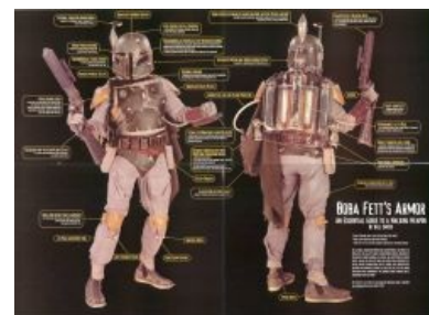
Бравый мандалор и его арсенал