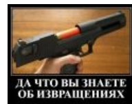
Пистолет? — Нет, дробовик!