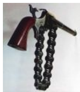
Револьвер с патронной лентой.