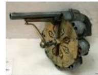
Револьвер с 8 барабанами