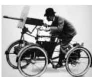
Motor Scout. Первый военный мотоцикл (1898).