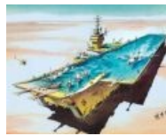
Авианосец, охраняющий запасы воды.