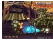
Сабж vs сабж.