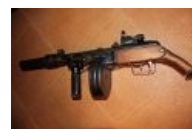
ППШ — вечно живой.