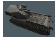
Вундерваффенный вафельтрагер на базе танка E-100 из World of tanks. Жестокый наркоман отдыхает.