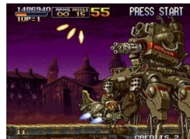
Типичная четырехногая вундервафля с огнемётом