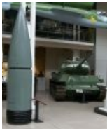
Снаряд Доры на фоне Т-34-85 и He.162