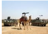
Китайцы такие китайцы.