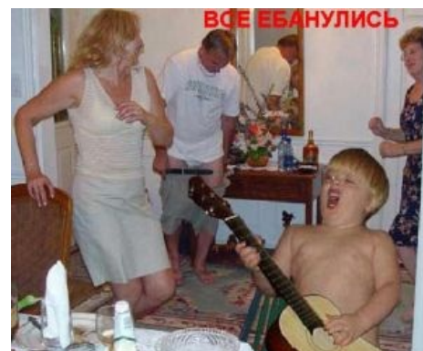
Оригинальное макро .

Первоначально цитата Епифанцева «Все ебанулись» была применена анонимусом по отношению к макро, основой для которого выступил снимок, сделанный, по-видимому, во время некоего семейного застолья, которое несколько вышло из-под контроля мозга . Интересно, что снимок является довольно старой фотожабой: на изначальное фото был добавлен пацан с гитарой, иногда встречающийся в забугорных интернетах. Выражение полюбилось Легиону , и вскоре начали появляться другие фотографии, снабжённые сакральной надписью. Как правило, на большинстве из этих макросов также изображён какой-либо праздник, который приобрел вследствие употребления синьки особо буйный и весёлый размах.