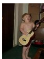
Тот самый пацан