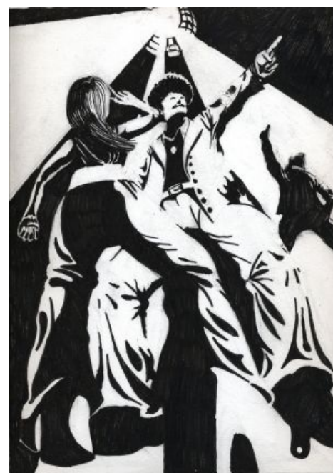
Узнаваемый бренд: дискотэка 80-х

К концу восьмидесятых оформился жанр «перестроечного» кино. Отечественный кинопроизводитель понял, что в эпоху гласности он может наконец-то невозбранно снимать «про правду». Как грибы после дождя (или как гробы после вождя) посыпались фильмы про кооперативы, мафию, коррупцию, рэкет, крутых парней, неформалов, наркоманов, проституток. Основной задачей «новых советских» фильмов была задача раскрытия темы сисек. Гнобимые в советскую эпоху небыдло-режиссёры стали ваять кино в стиле «советский арт-хаус». Вседозволенность привела к сильной концентрации чернухи на экранах кинотеатров страны, что, естественно, благотворно сказалось на прокатных сборах. Кроме того, неприкрытый флюродрос западу привёл к тому, что клюквы на иностранцев в отечественных фильмах стало меньше, а на самих себя больше. Перестроечное кино просуществовало вплоть до середины девяностых .