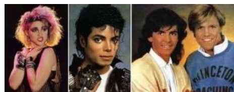
Иностранные поп-идолы восьмидесятых на советских плакатах

Полноценной поп-музыки в СССР не то чтобы не было... Просто своим делать в популярной на Западе манере не очень-то позволялось (хотя, ВИА были в этом смысле некоторым послаблением), Кобзон, Зыкина, Хиль , «Песняры», «Сябры», «Земляне» и прочие всякие леонтьевы всех основательно подзаебали, а забугорных звезд до советского зрителя и слушателя допускали мало.