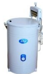
Советская цилиндрическая стиральная машина в вакууме aka «Таз с пропеллером» aka «Шайтан-Ведро» (выпускается по сей день)