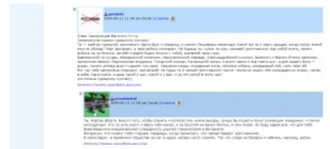
Иллюстрация к общему культурному уровню поциента ( пруфлинк )

А это современное его фото. Судя по постановке кружек, бурдюк жрёт пиво в два стакана!