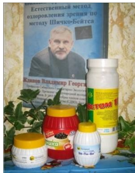
Чудо-препараты на фоне гуру.

Кроме того, уважаемый лектор утверждает, что сделан препарат на заводе, на котором разрабатывали системы защиты от атомного, химического и бактериологического оружия [2] .