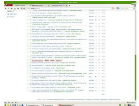
Юзеры ВиО такие дружелюбные