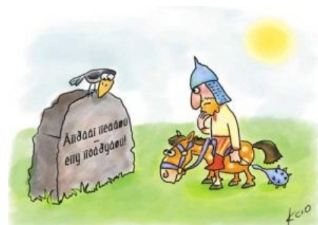
Типичная картина для типичного юзера.