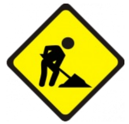
Неофициальный символ веба 90-х