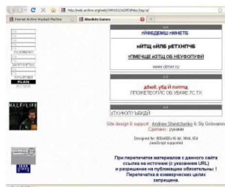
Один из самых популярных в Этой Стране сайтов о компьютерных играх — AG.ru в 1999 году. Сделано руками