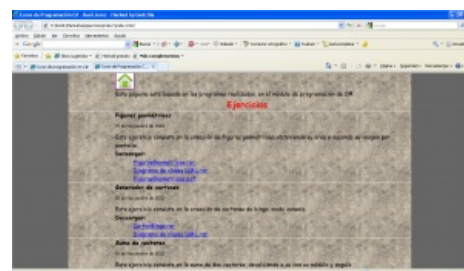
Web 1.0 собственной персоной