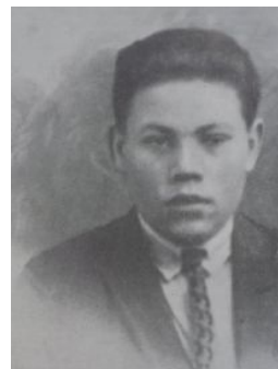
Последствия алкоголизма налицо