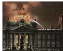
Сияло пламя мировой революции...