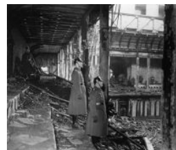
Сторожа: пришли на работу, а тут такая фигня...