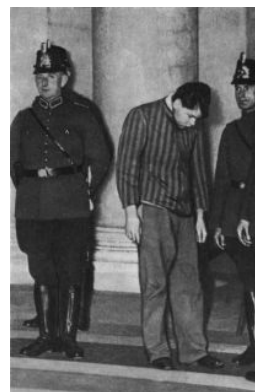
В полный рост