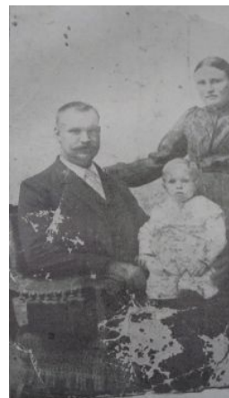
Взгляните на эти деревенские лица!

Всё началось ещё до злополучных событий, когда нацики смачно сосали красный хуец после провала их Пивного путча в 1923 году. Электорат смотрел на нациков как на коричневую чуму , а на