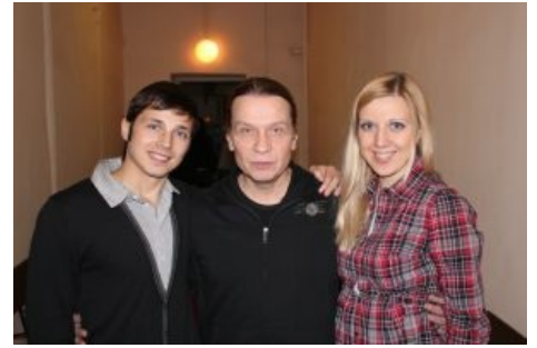
Кипфаны светятся от счастья

Как и у любого артиста, фаны — наиболее омерзительный тип ЦА , не признающий никого, кроме своего идола. Не то, что Беркута или Житняка в «Арии», а вообще никого. Самыми лютыми кипфанами, как правило, являются личности, совершенно не знакомые ни с творчеством сабжа, ни с металом вообще, а услышавшие по радио «Я свободен» или «Вавилон». Они же считают себя и ниибацца какими металлюгами.