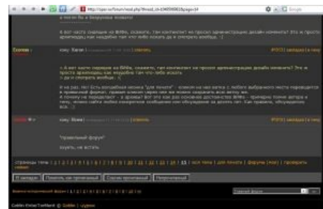
Гоблин начал что-то подозревать

Самое забавное, что история, с которой началась ВиФовская версия восстания пусек не стоила выеденного яйца. В некоторый момент на форуме в некотором тред е появился участник со славяносекским ником Святич. Который, внезапно, вопреки ожидаемому от такого ника, начал доказывать что результаты монгольского блицкрига на Руси не сильно отличались от того, что творили друг с другом и с подданными собственно русские князья. Ну, что конкретные пацаны с дружинами и в то время смотрели на крестьянское быдло как на говно и соответственно к нему относились — кто бы сомневался. С другой стороны, для конкретного быдлокрестьянина и может была какая-то разница — быть угнанным в полон единоверцами, говорящими на твоём же языке, или погаными язычниками. Опять же, манера татар вырезать нафиг, то есть подчистую, города, оказавшие сопротивление — хорошо известна. В то время как тот же Киев в ходе внутрирусских разборок, по словам самого