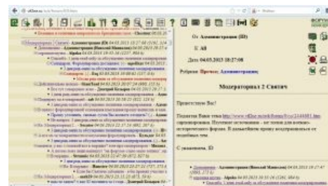
Переломный момент в жизни ВИФ2НЕ

Сам же заваривший кашу Святич не забанен, спокойно общается в других ветках давно забанен на год, и, подозреваю, ловит нехилые лулзы со всего происшедшего. Чего и вам желаю.