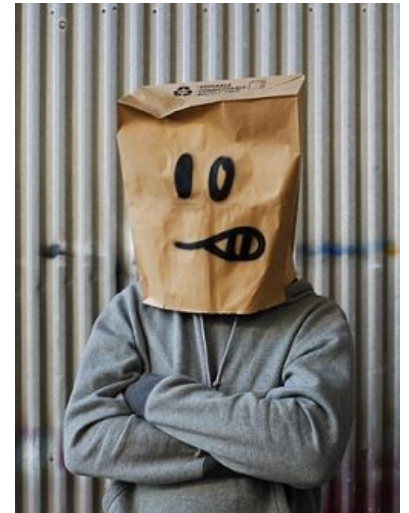
Фото Бэнкси для журнала TIME

Рисовать руками считает олдфажным отстоем и мажет стенки исключительно при помощи трафаретов. На этом поприще достиг немалых успехов, стал поповым, продал, при этом оставаясь анонимным (не спрашивайте как, анонимус не знает), туеву хучу кусков стен со своими шедеврами (работа «Борьба с вредителями» была продана с аукциона за $1,9 млн), издал книжку и киношку имени себя. Также является приятелем расовой британской группы Blur (создал обложку для альбома Think Tank). Кроме рисования на стенках, развлекался осовремениванием шедевров путем добавления в картины химических отходов, бытового мусора, оружия и прочих вещей для убивания человек. Периодически вешал данные полотна в серьёзных галереях, где они невозбранно висели от нескольких минут до нескольких недель. Является объектом фапа некоторых экологов, панков и небыдла за периодическое поливание помоями эцилопов, королевы-матки и корпораций.