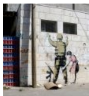
In Soviet Russia... Бэнкси намекает