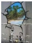
На берегу Иордана