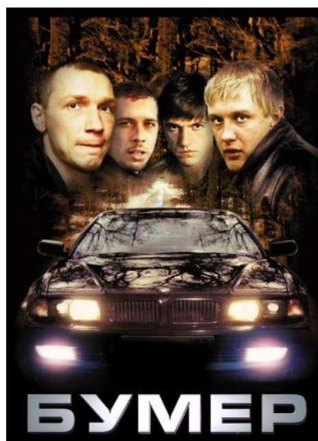
Фото сабжа на фоне гопников-переростков.