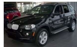
BMW X5 (E70), недожып