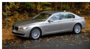
BMW 7-й серии (F01), членовоз