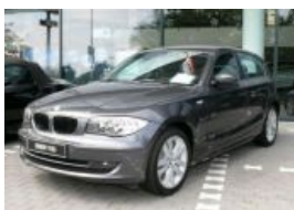
BMW 1-й серии (E87)