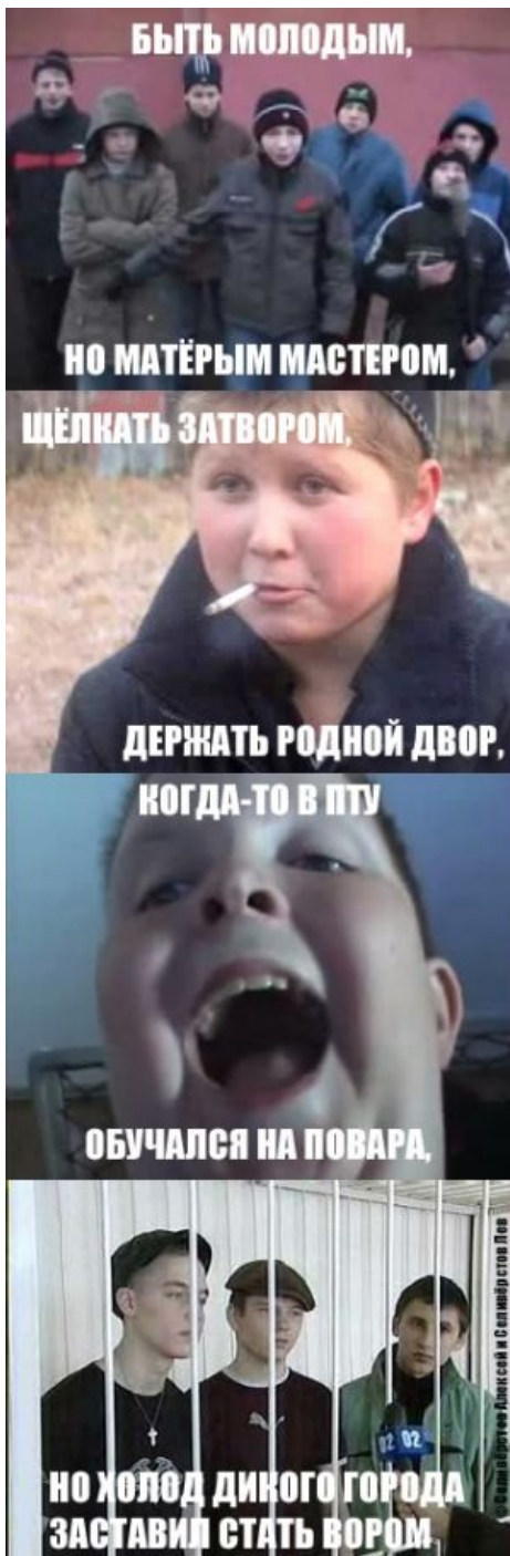
Ёнкама по песне из фильма