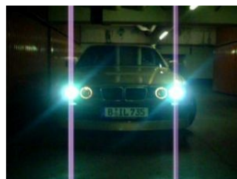
Сферический бумер в вакууме

Восточнее Уральских гор почти не встречается — там ввиду исторической праворульности функции «пацанских тачил» до сих пор с успехом выполняют «маркообразные» Тойоты (Mark II, Chaser, Cresta или вовсе Crown!) и аналогичного класса Ниссаны (Cedric, Laurel).