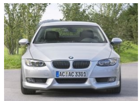
BMW смотрит на тебя, как на Ладу

Изначально авто затачивалось под скоростное передвижение по дорогам , однако владельцы умудряются эксплуатировать их даже в Замкадьё. Благодаря заебательской разгонной динамике и адекватной управляемости цепляет большинство севших за руль нормальных людей, а также бóльшую часть пассажиров, и делает из них фанатов BMW. Также, согласно педивикии, BMW является обладателем чуть менее, чем половины наград International Engine of