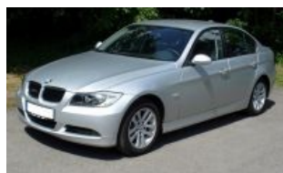
BMW 3-й серии (E90)