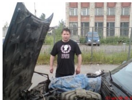
Расово верный пепелац. В симбиозе с сервитором ордена «Imperial Fists» .