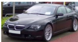
BMW 6-й серии (E63)