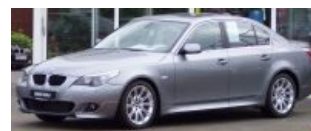
BMW 5-й серии (E60)