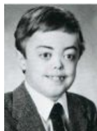
Детское фото. Красота внутри.