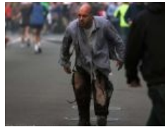
Участник бостонского марафона