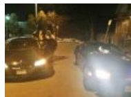
С другого ракурса