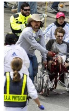
С другого ракурса