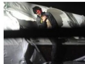
С другого ракурса