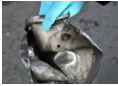
Скороварка — грозное оружие