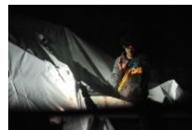
Джохар Царнаев в лодке

Сообщения в СМИ , что родные и близкие братьев Царнаевых клянутся, мол, ребятки — неугоуаты: они приличные парни и их подставили. Всплывает факт, что ФБР с Тamerланом уже имело дело в 2011 г. по наводке коллег из России на предмет его половых сношений с мусульманским экстремалом. 24-го апреля над раненым Джохаром проходит предварительный суд, с обвинением ни много ни мало в использовании оружия массового поражения. Говорить он не может, так как ранен в шею, но кивает в ответ на вопросы « Ты всё понел? ».