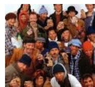
Как здорово, что все мы здесь сегодня собрались