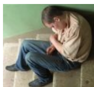
Мама, роди меня обратно.