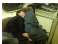
И ыццо так