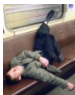
...А мне — в Медведки!