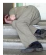
Нет бомжи на кораблю. Позвольте — Ваш порог слезами окроплю!