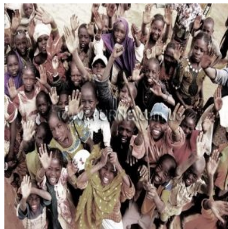
Любимые подданные Его Величествау.