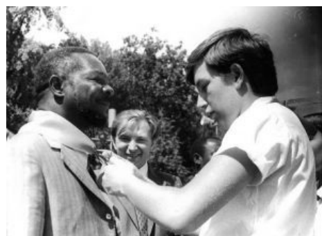
В Артеке (Бокасса смотрит на пионера с аппетитом)

Мясо от Бокасса / Meat from Jahn Bokassa Мясо от Бокассы