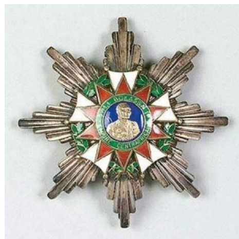
Орден Почетного людоеда.

Мясо от Бокасса / Meat from Jahn Bokassa Мясо от Бокассы