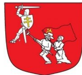
Лукашенковский герб. Так его видят змагары.