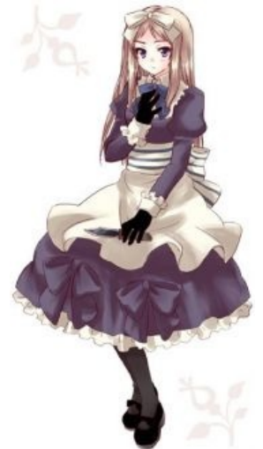
Наталья Арловская — персонификация Беларуси в Хеталии . Отношения с Россией и Литвой доставляют.

Когда инфляция уже начала превышать африканские показатели, пришло время начальству разобраться как следует и наказать кого попало . И что ви таки думаете — чуть позже состоялось внеочередное Батино откровение придворным таблоидам, на котором Лукашенко густо вбросил говна на вентилятор, обвинив народ в скупке валюты, сахара, спичек, машин, холодильников, блядей, в распиздяйстве на работе, алсо напомнив о мерзких планах гнилого запада и кровавой гэбни на лакомый кусок ака Беларусь. То есть в который раз всплывает прыдурковатая сущность поциэнта и маниакальная боязнь уражэских агентау в духе Холодной войны. Особо доставляют обвинения рашкинских СМИ в угнетании нерезидента нагнетании обстановки в стране , если вспомнить приверженность луканавтов советским принципам цензуры. В общем, соснули все, кроме главного .