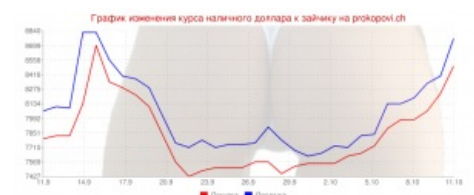
Очертания графика вполне узнаваемы...

Наступила осень и вместе с ней очередное эканамическая чуда. Скакнули квартплаты, в два раза выросли цены на жратву и прочие товары народного потребления (в очередной раз), которые, кстати, куда-то резко стали исчезать (в Гомеле, например, внезапно из магазинов испарились мясо, полуфабрикаты, торты, хлебобулочные (кроме самого хлеба), ну и прочие никому не нужные ништяки), а белка снова ёбнулась вниз и теперь один унылый енот стоит почти 8700 белок! Казалось бы, куда уж хуже, но то ли ещё будет... 13 октября 2011 на неофициальном всебелорусском обменнике prokopovi.ch был замечен график обмена, отражающий полный стабилизец местной валюты.