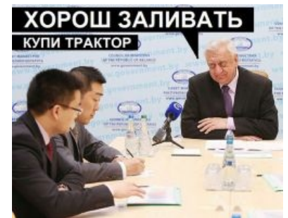
Михаил Хазин О Белоруссии Михаил Хазин О Белоруссии

Куплет: Ехали в Голландию бульбаши петь. Начали Европу всю бульбой угощать. Нет на свете ничего лучше драников из печи. Этот вкус помогает всех победить. Припев: бульба это супер-класс, оборонит бульба нас ото всякой атипичной малярии. Бульба это образ жизни, нету лучше ощущения, чем поесть бульбы с мяском. Куплет: Бульбу жарят во фритюре только за границей. Съешь такое на десерт - в пузе непокой. Чтоб всегда здоровым быть - бульбу отвари, и сразу вырастёшь - до горы.