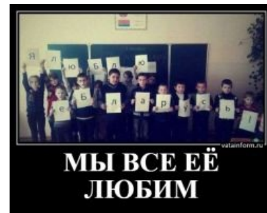
Незначительный фейл в белорусской школе.

И того — из всего этого следует, что нехуй сравнивать жопу с пальцем, ибо результат будет как всегда предсказуем . Среднестатистическому бульбашу на самом деле до одного места на все эти ваши блага загнивающей дерьмократии, которых одинхер в его краях никогда не было. У него чарка со шкваркой на столе, нива под жопой и совок за окном.