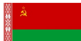
Найдите 10 отличий