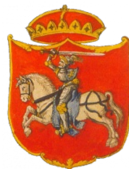
Тот самый герб ВКЛ, который является историко-культурной ценностью Белоруссии. Хотя змагарам похуй