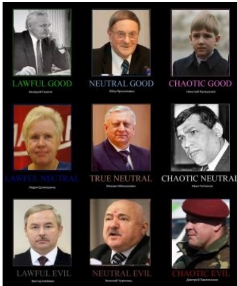
Команда Бацьки altogether