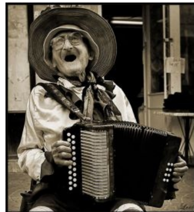
Снесла курочка дедушке...