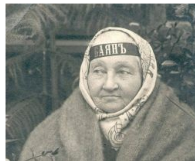
Бабушка Русской революции как бы намекает

Есть еще такая: в домино — очень популярной среди советского рабочего класса настольной игре — баяном называлась костяшка 6/6 (шесть/шесть). Любая доминошка с одинаковыми числами на обеих половинках (1/1, 2/2 и т. д.) называлась «дубль», а «баян» был самым запоминающимся из них, имеющим к