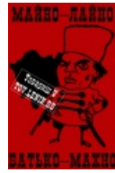
Карикатура на Батька