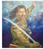
Махно эпичен аки Жуков Об авторе сего