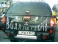
Тачанка на новый Рашкинский 12-лад