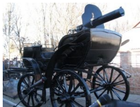
Тачанка в Гуляйполе

Разумеется, помимо пулемётного огня тачанка доставляла ещё и тонну лулзов. Так, например, импровизированные «номерные знаки»: спереди на тачанке было написано «ХУЙ УЙДЁШЬ», а сзади — «ХУЙ ДОГОНИШЬ»