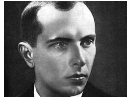
Степан Андреевич Бандера смотрит на тебя, как на москаля

Современные бандеровцы всеми силами пытаются создать образ Бандеры-антифашиста, нередко даже можно услышать, что Бандера всю войну проторчал в концлагере, но гораздо реже — в каком именно концлагере. С 1941 по 1944 год Бандера провёл в комфортных условиях спецбарака «Целленбау» для