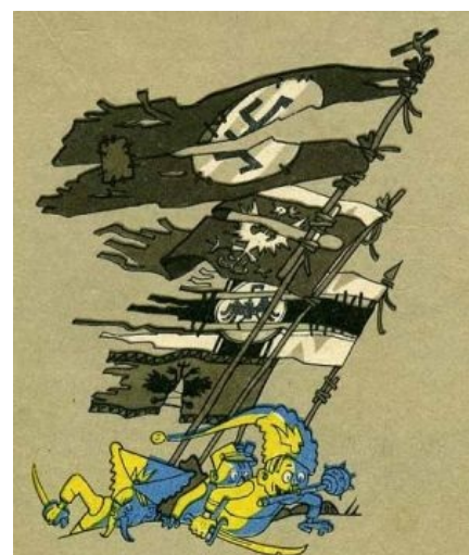
Сабж глазами советского художника

Термин, в отличие от политрука, крайне употребимый в украинских интернетах русскими поцреотами для обвинения собеседника в украинском национализме, русофобии и шпионаже в пользу Америки.