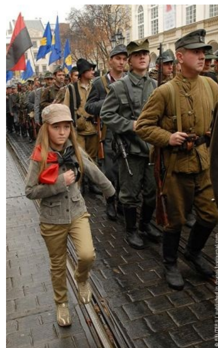
Среди них есть лолы

Эта статья часто становится объектом войны правок . Кроме того, её периодически рейдят малолетние укропклонники сабжа. Поэтому, если вы заметите здесь некошерные , на ваш взгляд, вещи — просим не кидаться, сломя голову, восстанавливать справедливость и тем самым разжигать новый срач . Без сопливых разберемся.