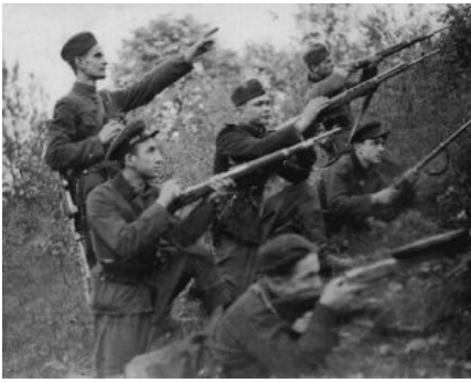
Сферический в вакууме жыдобандерівець

« Жидобандеровец — немного странный, как по мне термин. Он содержит две взаимоисключающих части, причём вторая часть занималась исключением первой физически, и, надо сказать, довольно успешно »