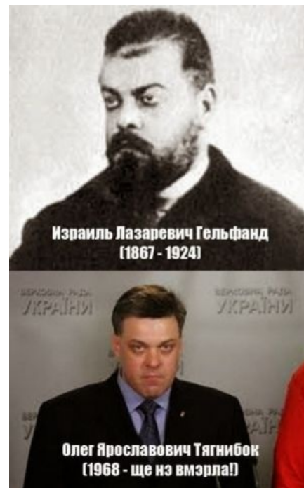
Олег Тягнибок и его предок.

Неправильные имена (Урок грамотности) Фарион такая Фарион. Юрій Михальчишин: Кінчай знімати! За...бав! Михальчышин общается с пролетариатом. Василь Кук - генерал УПА, последнее инервью Последнее интервью.