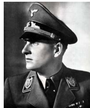
Бальдур фон Ширах. Характер нордический.

Как известно, русский слешер в основном состоит из граждан женского полу . Активисты гомоэротики , как правило, ебанутые на голову незамутнённые девицы-школьницы и бабищи средних лет, ниже среднего уровня доходов, так как главная составляющая слешера — ОБВМ — с высокими доходами не совместим принципиально [3] . Вот в поле зрения одного из них и случилось попасть нашему герою. Русский слешер любит искренне, чисто и рьяно. Чуть более, чем всеми описанными в камасутре способами. Таким образом, рейхсгорюшко Ширах превратился в блядину с яйцами, дающую во все дыры всем желающим, а нежелающих убеждает пересмотреть свою позицию [4] . Также он приобрёл звание Божественно Прекрасного, так как ебать небожественное теоретически русский слешер отказывается