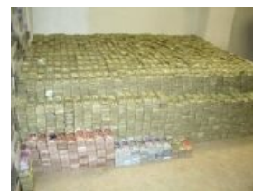
Лютое, бешеное бабло

Возможность существования сабжа обусловлена единственным критерием: Анонимус должен государству деньги, а для этого они