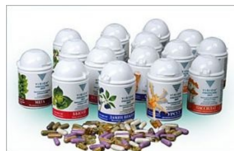
БАДы. Тысячи их!

За свою невероятную квазицелebность получили в народе классы « Фуфломицины », «наеБАДы», «Пиздальгины», «противотанковые витамины», «сушёные квадратные корни», «лохотропины» и многие другие. В девятнадцатом веке были известны скопом как «патентованные средства».