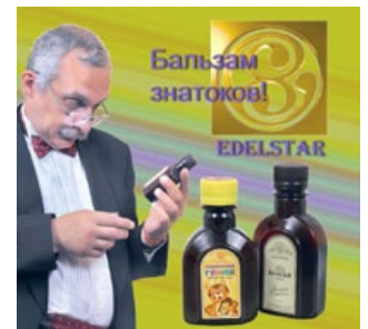
Знарок и пузырьрёк

Формально, БАДы проходят сертификацию на безопасность. Отличия от лекарств — в нюансах. БАД должен быть ( спойлер : всего лишь не йадовит), а вот лекарство, к тому же, ещё и что-то лечить. На деле их проверять некому и нафиг никому не надо. Все БАДы представляют из себя мелко покрошенную и спрессованную в таблетки сушёную травку неизвестного вида и, тем более, непонятного действия на организм. Различить, что это за травы, можно разве что под микроскопом, и то специалисту с большим количеством знаний и времени. А завозят их тоннами каждый день. Так что все смирились и никто ничего не проверяет. Можно смело провозить хоть коноплю в таблетках.