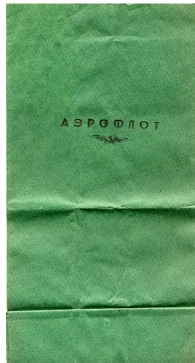
...и гигиенический пакет. Вместе и навсегда

И с грустью возвращая стюардессе Навеки замороженных цыплят, Я говорю, что я живу в Одессе, — У нас в Одессе это не едят!