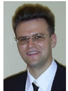
Типичный антисексуал асексуален

Еще раз, коротко: асексуалами рождаются, антисексуалами становятся.