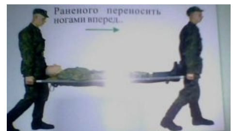
Армейский способ переноски раненых