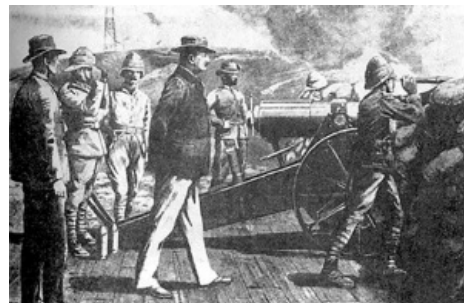
Родс рядом с «Длинным Сесилем». Осажденный Кимберли

английских гастарбайтеров в Трансваале вступили ирландская и шотландская гвардия. Вопреки устоявшемуся мнению, в упорных боях британцы чаще всего превосходили буров, в силу скудности людских ресурсов уклонявшихся от рукопашной и защиты своего окопа до последней капли крови, и занимали их позиции . Но с вершины очередной отбитой высоты открывался вид на новые уходящие за горизонт гряды холмов, занятых неприятелем. Когда же на пути англичан вставало непреодолимое препятствие вроде реки или проволочного заграждения, позиция оставалась за бурами. «Высокие» потери (в редких боях потери убитыми превышали сто человек), боязнь флангового обхода, недостаток кавалерии и артиллерии, а также общий упадок духа вынудили англичан засчитать себе техническое поражение и перейти к стратегической обороне.