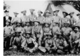
Мохандас Ганди [10] в британском лазарете постигает тщетность вооружённой борьбы