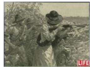
Жена команданта Крантца выцеливает очередного томми

Даже лошадь коммандос на тебя не смотрит