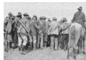
Даже лошадь коммандос на тебя не смотрит