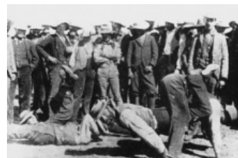
Суровые южноафриканские развлечения