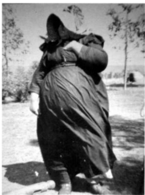
Сферическая бурская женщина в чепчике

Давным-давно, когда британский лев был ещё котёнком , владычицей морей была Голландия. В те времена путешествие на корабле в далёкие страны за перцем, корицей и прочими приправами занимало многие месяцы и было сопряжено со многими опасностями. Кораблю и экипажу нужна была надёжная гавань, где можно было бы передохнуть, укрыться от бурь, починить свою посудину, запастись свежей водой и няжкой, да и просто спокойно поиграть в картишки и пройти курс шлюхотерапии . В этом смысле Столовая бухта у мыса Доброй Надежды, находящаяся на полпути из Европы в Индию, оказалась для голландских челноков как нельзя кстати. И в 1652 голландская Ост-Индская компания основала в означенной бухте поселение Каапстад и начала завозить туда голландских и фламандских крестьян для обеспечения города едой .