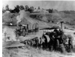
«Боевые кони ищут брода»