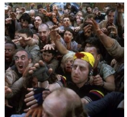
Зомби с АГП

Ну разумеется, преступление — не сбрасывать напалмовые бомбы на женщин, детей и стариков, а протестовать против этого. Преступно не уничтожение посевов — что обрекает миллионы на голодную смерть — а протест против этого. Не разрушение электростанций, лепрозориев , школ и плотин — а протест против этого. Не террор и пытки, применяемые «частями специального назначения» в Южном Вьетнаме — а протест против этого. Недемократичны не подавление свободного волеизъявления в Южном Вьетнаме, запрет газет, преследования буддистов — а протест против этого в «свободной» стране. Считается «дурным тоном» бросаться в политиков пудингом и творогом, а вовсе не принимать с официальным визитом тех политиков, по чьей вине стирают с лица земли целые деревни и бомбят города. Считается «дурным тоном» устраивать на вокзалах и уличных перекрестках дискуссии об угнетении вьетнамского народа, а вовсе не колонизировать целый народ под предлогом «борьбы с