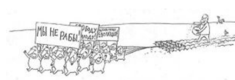
Гиперактивный квасной патриот Терминальная стадия АГП

При заражении поциент испытывает непреодолимое желание публично высказывать своё мнение , причём обязательно сбившись в стадо: посещать митинги и пикеты, устраивать гей-парады , Митинги , Русские марши , марши несогласных , конопляные марши , антипризывные марши , молитвенные стояния , флешмобы , сборы подписей , акции протеста ( голубые ведерки и парковщики ) и тому подобные бесполезные мероприятия.