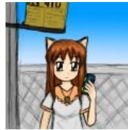
ЮВАО-тян ждет автобус