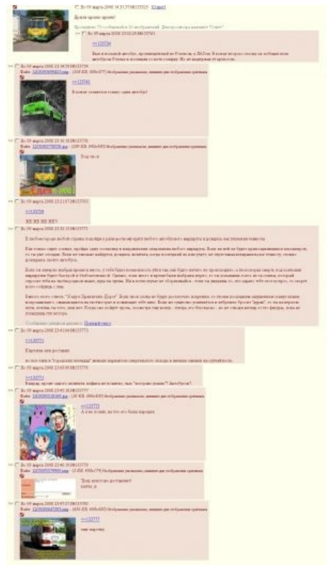
Скриншот из /b/, а не из /tr/, как может показаться на первый взгляд