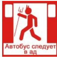
И еще одна