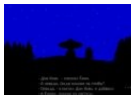
А почему бы и нет?