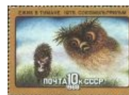
И даже in Soviet PostOffice