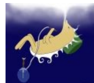
А на самом деле