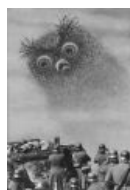
Филин пугает фашистов