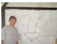
Юный вариант в египетском отеле написал на стене, чем он занимается на отдыхе