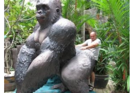
Руссо-туристо в сандаликах поверх белых носков