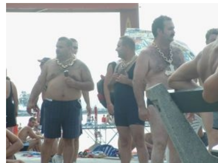
Таковыми они были в 90-е [1]

Turkey / Русские туристы в Турции Историческое видео «Ром с колой», или тупая пизда как руссо туристо