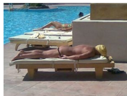
Русский турист на египетском взморье

https://www.youtube.com/watch?v=tq2oCORh_KA Чувак очень хочет поехать в Египет