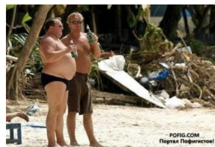
Цунами быдлам не страшны