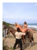
Руссо-туристки меряются с мулом жопами